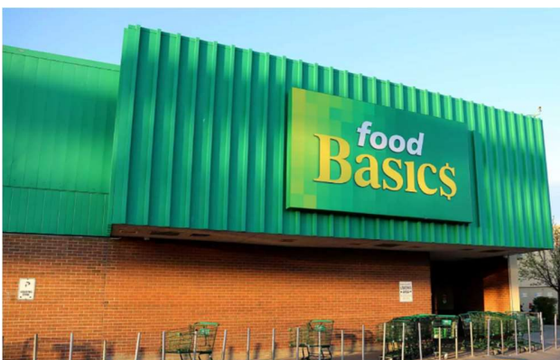
Food Basics 食品超市