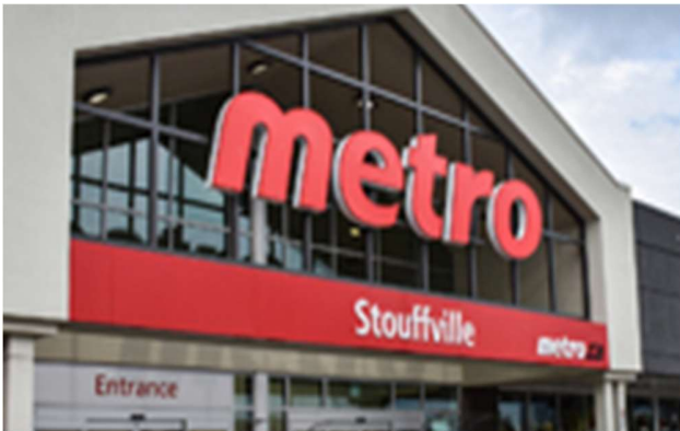
Metro (卖球) 食品超市