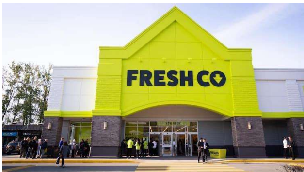
Fresh co (福来-虚扣) 食品超市